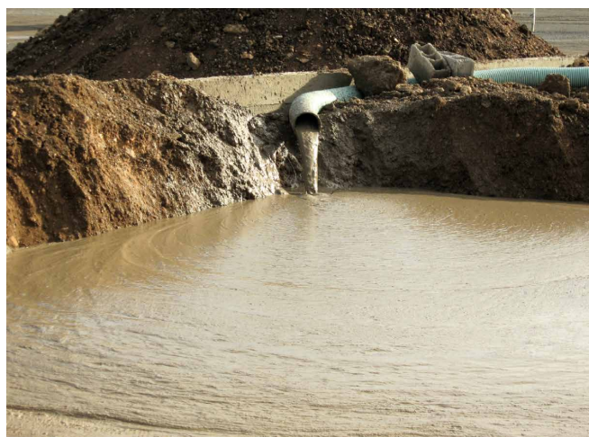
Stockages des boues en bassin. (solution la plus courante de nos jours).