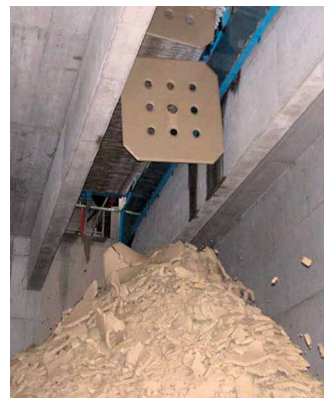
Sortie de boue déshydratée.