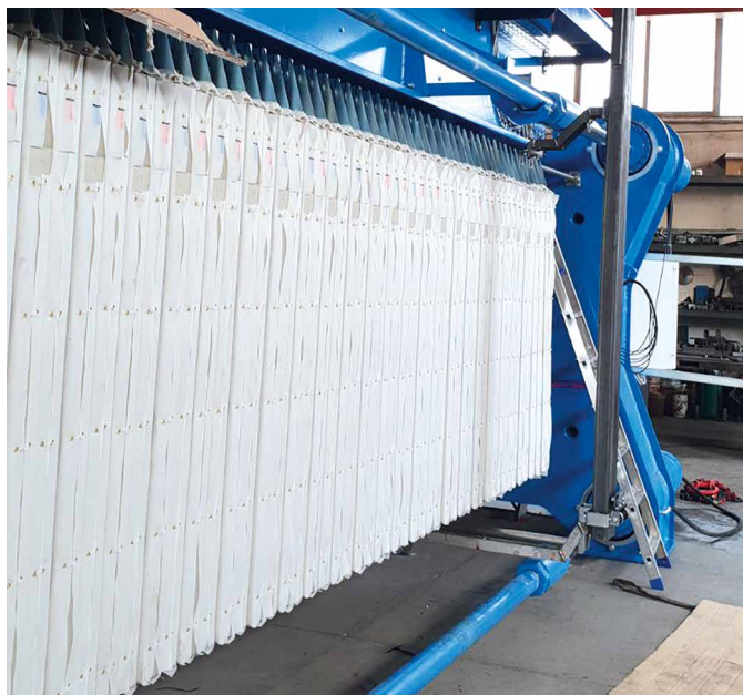
Filtres presses entièrement automatisés et adaptés à différents types d'industrie.